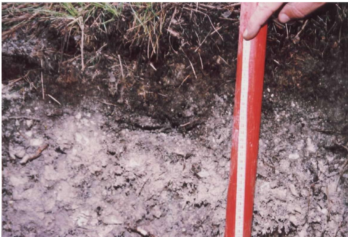
Рис. 2. Почвенный разрез пробной площади № 3

Сосна за много тысяч лет произрастания на мелах адаптировалась в кальциевых ландшафтах, что обеспечивает