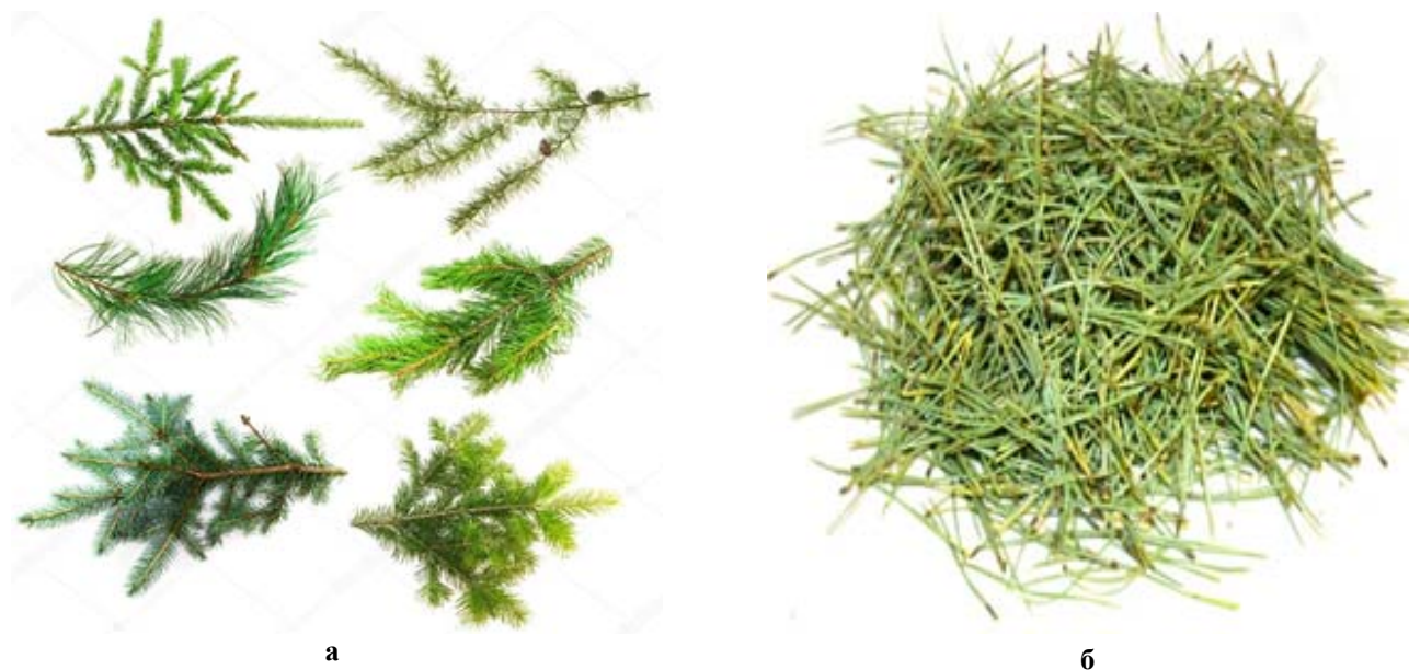
Рис. 2. Хвойные лапки различных пород деревьев – а и хвоя после отделения и очистки – б

Вследствие большого разнообразия деревьев хвойных пород, заготавливаемые лапки существенно отличаются между собой по таким показателям, как количество ветвей (одно- и многоветвевые) и их размерам (длине и диаметру), размерам хвоинок (длине, ширине, толщине) и форме их сечения (квадратные, треугольные, круглые, плоско-выпуклые, эллипсовидные), количеству хвоинок в побеге или на ветви (одно-пяти-игольчатые, пучковые) и др. (рис. 2, а). Такие отличия хвойных лапок важно учитывать при обосновании как основных геометрических параметров агрегатов и узлов, так и необходимой мощности установки на СВЧ процесс обработки. В действующем в настоящее время государственном стандарте к качеству хвои, получаемой после операции отделения (рис. 2, б), предъявляется ряд требований [9]. В частности, в зависимости от содержания коры, хвои, листьев, древесины, неорганических и органических примесей ДЗ подразделяют на три сорта в соответствии с табл. 1. Из таблицы следует, что величина суммарной доли примесей допускается значительной по величине и составляет 20-40 %. Такие нежесткие требования стандарта объясняются в основном тем, что существующие промышленные технологии и применяемое оборудование для отделения и очистки ДЗ все еще крайне несовершенны и не в состоянии обеспе-