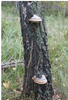
Рис. 10. Плодовые тела гриба на берёзе – свидетельство наличия стволовой гнили

Плодовые тела гриба в обследованном насаждении ошмыг наблюдались лишь у 1 дерева берёзы (0,5% деревьев).