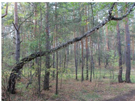
Рис. 7. Наклон ствола берёзы

Толстые скелетные ветви могут считаться патологией, если они имеют большой размер и массу и по диаметру сопоставимы с диаметром ствола (рис. 8). Обычно это происходит в разреженных насаждениях с низкой сомкнутостью полога, где рост кроны идёт преимущественно в ширину, и напротив, при высокой полноте насаждения деревья рано очищаются от сучьев. При наличии толстых скелетных ветвей на ствол дерева приходится большая нагрузка, что может приводить к образованию трещин и облому ветвей. В дальнейшем место облома зарастает каллюсной тканью, но на месте повреждения крупных ветвей рана может затягиваться долго или вовсе не зарастать полностью [2]. Это вредит жизнеспособности растения, так как места ран проще заражаются гнилевыми и грибными болезнями, что приводит к разрушению древесины. В обследованном насаждении толстые скелетные ветви отмечались у 28 (14,4%) деревьев.