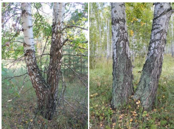
Рис. 2. Раздвоение ствола берёзы на разной высоте (фото автора)

Различные виды патологий формы ствола были выявлены у 25 (12,9%) обследованных деревьев мягколиственных пород. Доминировало среди них раздвоение ствола, причём встречалось как раздвоение, начинающееся сразу от земли, так и происходящее на различной высоте ствола (рис. 2).