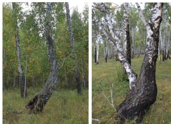
Рис. 5. Искривление стволов березы

лению ствола, является неравномерность поступления света, так как для деревьев характерен наклон в сторону лучшего освещения. К искривлению может приводить и многостволие в молодом возрасте, и скрытая корневая гниль. Кривизна ствола бывает различных форм и степени искривления (рис. 5). Так, например, различают простую и сложную кривизну, выделяют такие формы, как саблевидность, серповидность, спиралевидность и т.п. В зависимости от этих характеристик, влияние данной патологии на жизненное состояние дерева и товарность получаемой древесины также различно. В данном насаждении искривление (изгиб) ствола было отмечено у 13 (6,7%) деревьев мягколиственных пород.