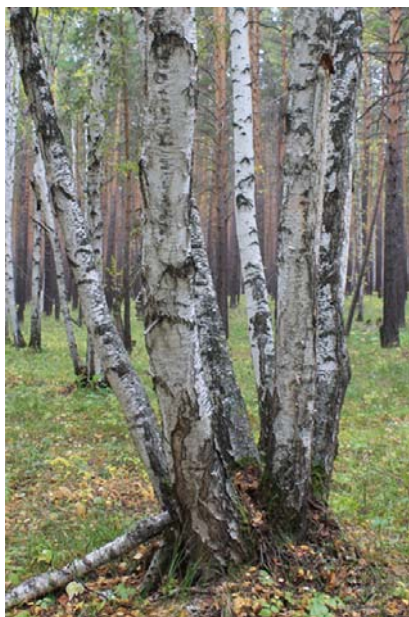
Рис. 4. Многостволие на берёзе

Обычно срастание происходит на ранних этапах жизни дерева, за счёт более тонкой в молодом возрасте коры. Этот вид патологии формы встречается в насаждениях относительно редко, в данном насаждении его выявлено не было. Тем не менее в зависимости от месторасположения срастания, его площади и степени, эта патология может значительно влиять на дерево, снижая его жизнеспособность, и сопровождаться многостволием, усыханием ветвей, ранами с последующим развитием сопутствующих заболеваний, а при достаточно сильном ветре может приводить к разрывам.