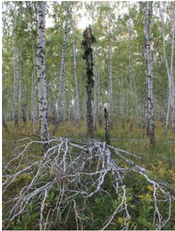
Рис. 9. Облом вершины у берёзы

Облом вершины в данном насаждении встречался единично (у 3, или 1,5% деревьев).