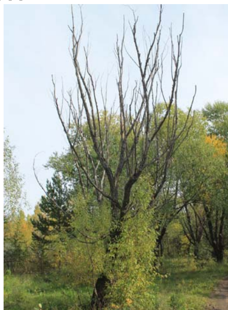
Рис. 1. Патологическое усыхание вершины ивы козьей

ния дерева (грибковые, бактериальные болезни и т.д.) [1].