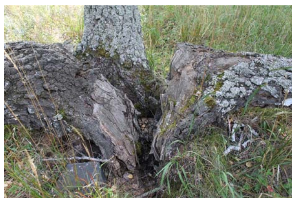
Рис. 3. Раскол ствола берёзы

Особенно опасны крупные разветвления, при которых два ствола либо толстые ветви отходят друг от друга под большим углом, так как это может привести к расколу ствола. На рис. 3 представлен такой раскол ствола, вызванный патологией его формы (раздвоением).