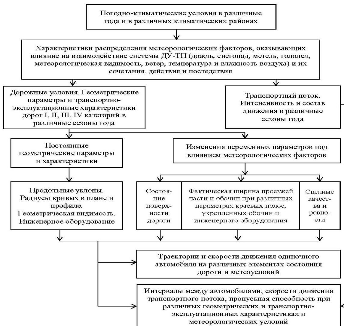
Рис. 1. Блок-схема комплексных экспериментальных исследований

Комплексные обследования и наблюдения были выполнены на дорогах I, II, III, IV категорий во II, III и IV дорожно-климатических зонах, общим протяжением около 2 тыс. км. Кроме того, экспериментальные исследования по отдельным вопросам выполнялись на лесовозных автомобильных дорогах Республики Коми.